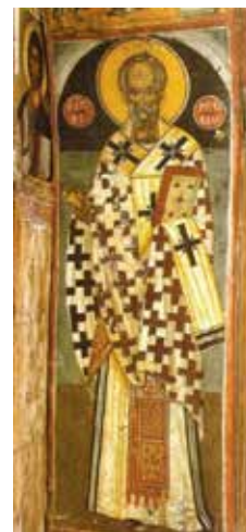
Mănăstirea Sfântul Nicolae Anapavsa Meteoră, frescă din 1527, de Teofan Cretanul

Mulțumim călduros FAMILIEI PRINCIARE STURDZA pentru imprimarea gratuită a Revistei noastre parohiale.